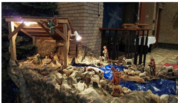
Kerststal 2016, Thema: bootvluchtelingen

In KELPEN-OLER functioneert een PAROCHIERAAD,