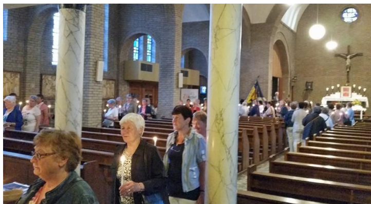
Kringviering Zij-Actief in onze kerk.

Dit nummer s.v.p. niet gebruiken voor uw Kerkbalansbijdrage.